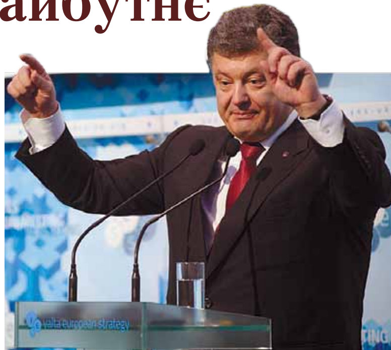
Президент України Петро ПОРОШЕНКО

– Енергетична безпека: сьогоденні питання життя і смерті.